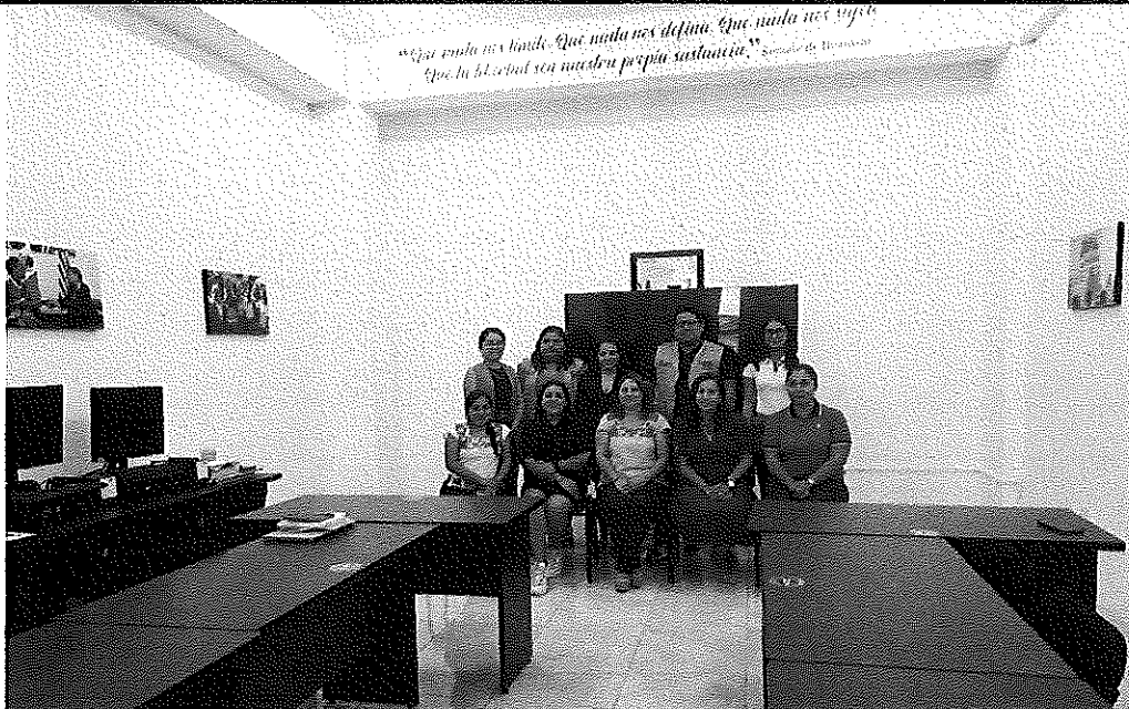
Evidencia fotográfica de la reunión de seguimiento a las actividades del Comité de Participación Ciudadana por parte del INMUJERES, de fecha 11 de septiembre de 2023: