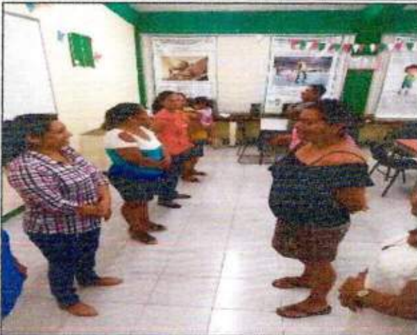
Sesión de trabajo para la construcción de un plan de acción comunitaria con las integrantes de la Red MUCPAZ (Mujeres Líderes en Paz) del municipio de Othón P. Blanco. 20/octubre/2023