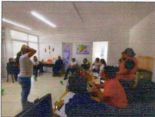
Sesión de trabajo para la construcción de un plan de acción comunitaria (Mujeres unidas para Tulum) del municipio de Tulum. 09/noviembre/2023