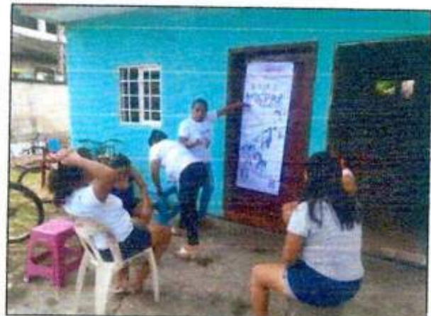
Sesión de trabajo para identificar un espacio a recuperar con las integrantes de la Red MUCPAZ (Mujeres en Armonía) del municipio de Benito Juárez – Región 75. 25/octubre/2023