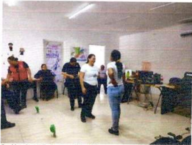
Sesión de trabajo para identificar un espacio a recuperar con las integrantes de la Red MUCPAZ (Mujeres unidas para Tulum) del municipio de Tulum. 16/noviembre/2023