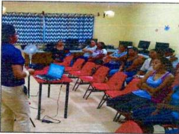
Capacitación a las integrantes de la Red MUCPAZ (Mujeres Mayas en Acción) del municipio de Felipe Carrillo Puerto. 15/octubre/2023.