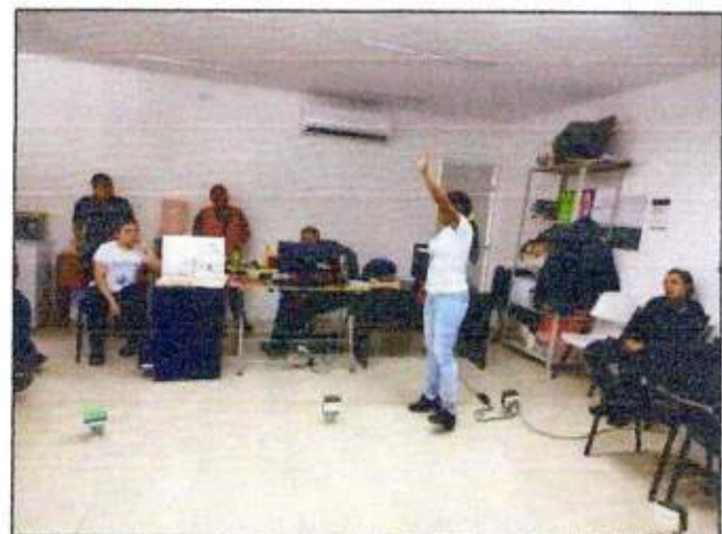
Sesión de trabajo para la construcción de un plan de acción comunitaria (Mujeres unidas para Tulum) del municipio de Tulum. 09/noviembre/2023