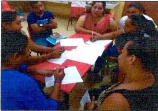
Sesión de trabajo para identificar un espacio a recuperar con las integrantes de la Red MUCPAZ (Mujeres Renacimiento por la Paz) del municipio de Lázaro Cárdenas. 17/octubre/2023