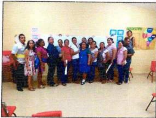
Sesión de trabajo para la construcción de un plan de acción comunitaria (Mujeres Mayas en Acción) del municipio de Felipe Carrillo Puerto. 29/octubre/2023