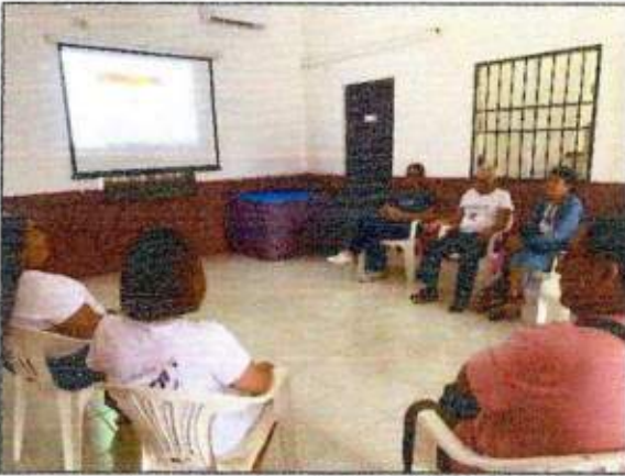
Capacitación a las integrantes de la Red MUPCAZ (Golondrinas de Cozumel) del municipio de Solidaridad. 19/octubre/2023.