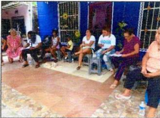
Capacitación a las integrantes de la Red MUCPAZ (Mujeres en armonía) del municipio de Benito Juárez – Región 75. 11/octubre/2023