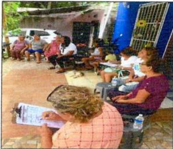
sesión de trabajo a las integrantes de la Red MUCPAZ (Mujeres en Armonía) del municipio de Benito Juárez - Región 75. 18/octubre/2023.