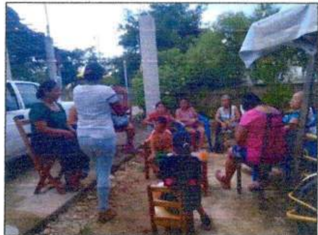
Sesión de trabajo para identificar un espacio a recuperar con las integrantes de la Red MUCPAZ (Mujeres Mayas en Acción) del municipio de Felipe Carrillo Puerto. 05/noviembre/2023