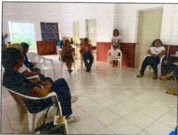
Sesión de trabajo para la construcción de un plan de acción comunitaria (Golondrinas de Cozumel) del municipio de Cozumel. 26/octubre/2023