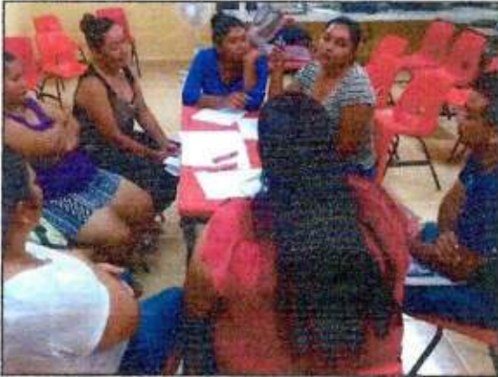
Capacitación a las integrantes de la Red MUPCAZ (Mujeres en Renacimiento) del municipio de Lázaro Cárdenas. 03/octubre/2023.