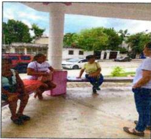
Sesión de trabajo para identificar un espacio a recuperar con las integrantes de la Red MUCPAZ (Mujeres en Renacimiento) del municipio de Benito Juárez - Región 68. 30/octubre/2023