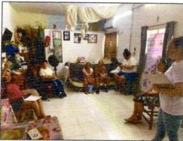
Capacitación a las integrantes de la Red MUCPAZ (Mujeres en renacimiento) del municipio de Benito Juárez - Región 68. 16/octubre/2023