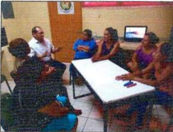
Sesión de trabajo para la construcción de un plan de acción comunitaria con las integrantes de la Red MUPCAZ (Mujeres Transformadoras de Paz) del municipio de José María Morelos. 05/octubre/2023