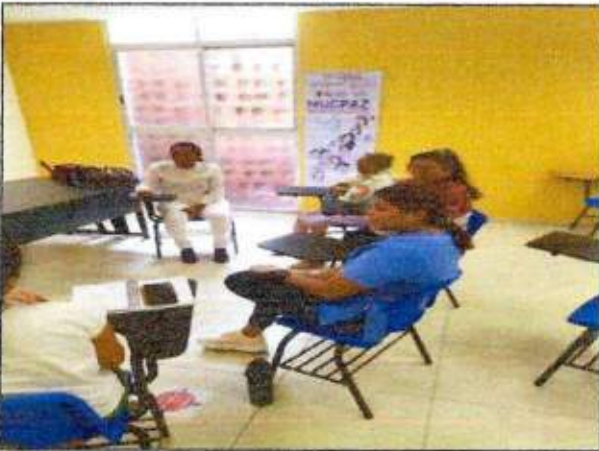
Sesión de trabajo para identificar un espacio a recuperar con las integrantes de la Red MUCPAZ (Mujeres transformadoras de paz) del municipio de José María Morelos. 19/octubre/2023