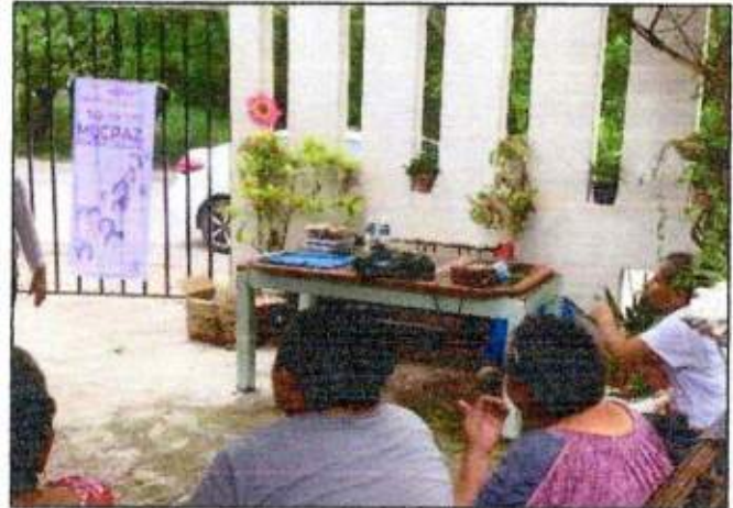
Capacitación a las integrantes de las Red MUCPAZ (Mujeres en renacimiento) del municipio de Benito Juárez – Región 68. 16/octubre/2023