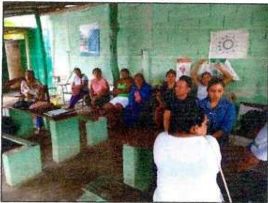
Capacitación a las integrantes de la Red MUCPAZ (Mujeres de Paz en Bacalar) del municipio de Bacalar. 26/octubre/2023.