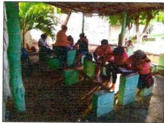
Capacitación a las integrantes de la Red MUCPAZ (Mujeres de Paz en Bacalar) del municipio de Bacalar. 26/octubre/2023.