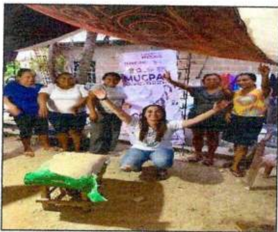
Sesión de trabajo para la construcción de un Plan de Acción Comunitaria de la Red MUCPAZ (Mujeres Creadora de Paz) del municipio de Isla Mujeres. 27/octubre/2023.