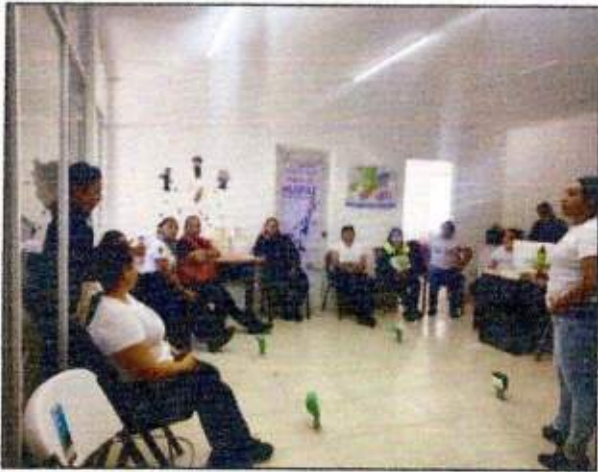
Capacitación a las integrantes de la Red MUPCAZ (Mujeres Unidas para Tulum) del municipio de Tulum. 26/octubre/2023.