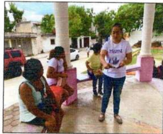
Sesión de trabajo para identificar un espacio a recuperar con las integrantes de la Red MUCPAZ (Mujeres en Renacimiento) del municipio de Benito Juárez - Región 68. 30/octubre/2023.