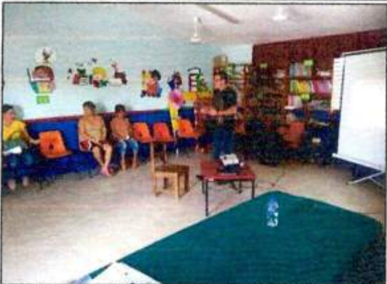
Capacitación a las integrantes de la Red MUPCAZ (Mujeres Recreatoras de Puerto Morelos) del municipio de Puerto Morelos. 19/octubre/2023.