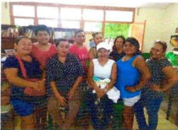
Capacitación a las integrantes de la Red MUPCAZ (Mujeres Unidas por la Paz) del municipio de Solidaridad. 06/octubre/2023.