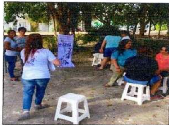
Sesión de trabajo para la construcción de un Plan de Acción Comunitaria de la Red MUCPAZ (Mujeres recreadoras de Puerto Morelos) del municipio de Puerto Morelos. 26/octubre/2023.