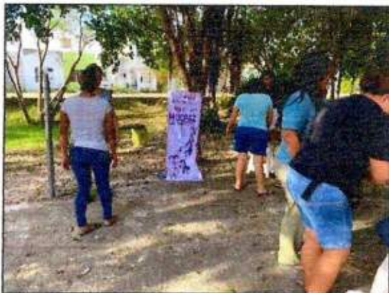
Sesión de trabajo para la construcción de un Plan de Acción Comunitaria de la Red MUCPAZ (Mujeres recreadoras de Puerto Morelos) del municipio de Puerto Morelos. 26/octubre/2023.