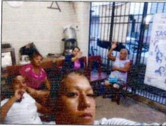
Capacitación a las integrantes de la Red MUCPAZ (Mujeres Líderes en Paz) del municipio de Othón P. Blanco. 13/octubre/2023.