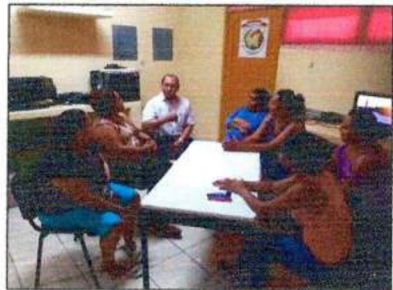
Sesión de trabajo para la construcción de un plan de acción comunitaria con las integrantes de la Red MUPCAZ (Mujeres Transformadoras de Paz) del municipio de José María Morelos. 05/octubre/2023