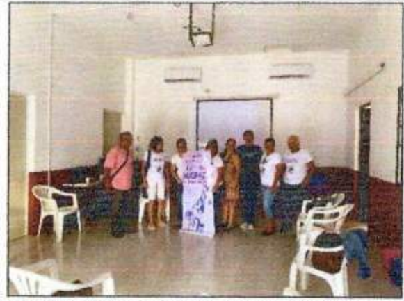
Capacitación a las integrantes de la Red MUPCAZ (Golondrinas de Cozumel) del municipio de Solidaridad. 19/octubre/2023.