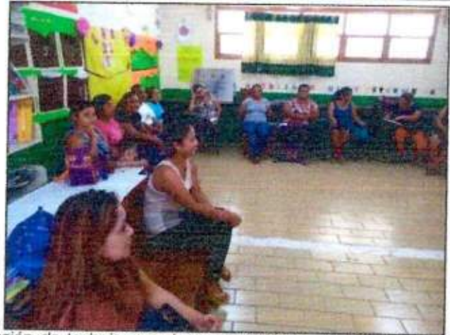
Sesión de trabajo para la construcción de un plan de acción comunitaria (Mujeres Unidas por la Paz) del municipio de Solidaridad. 20/octubre/2023