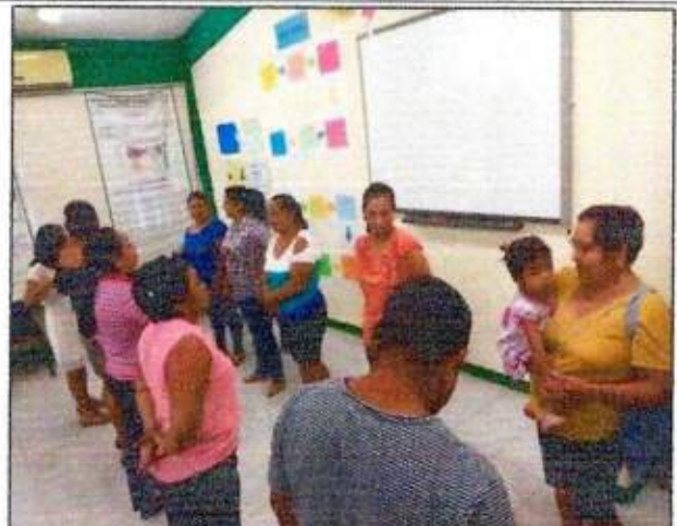
Sesión de trabajo para la construcción de un plan de acción comunitaria con las integrantes de la Red MUCPAZ (Mujeres Líderes en Paz) del municipio de Othón P. Blanco. 20/octubre/2023