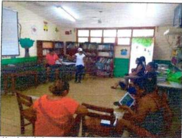
Sesión de trabajo para la construcción de un plan de acción comunitaria (Mujeres Unidas por la Paz) del municipio de Solidaridad. 20/octubre/2023