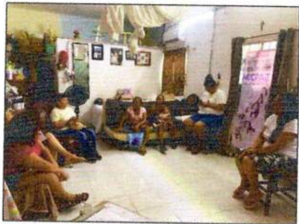
Sesión de trabajo para la construcción de un plan de acción comunitaria con la Red MUCPAZ (Mujeres en Renacimiento) del municipio de Benito Juárez – Región 68. 23/octubre/2023