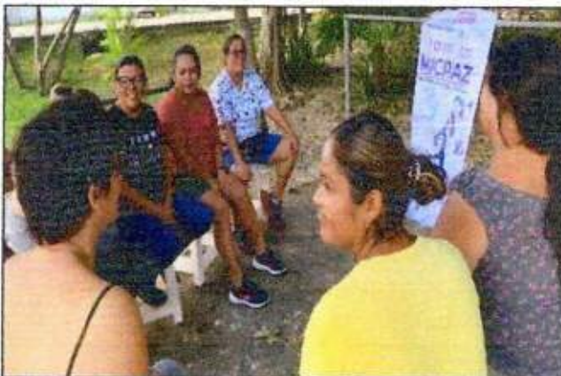
Sesión de trabajo para identificar un espacio a recuperar con las integrantes de la Red MUCPAZ (Mujeres Recreatoras de Paz) del municipio de Puerto Morelos. 09/noviembre/2023