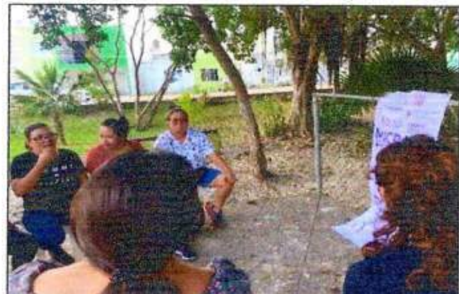
Sesión de trabajo para identificar un espacio a recuperar con las integrantes de la Red MUCPAZ (Mujeres Recreatoras de Paz) del municipio de Puerto Morelos. 09/noviembre/2023