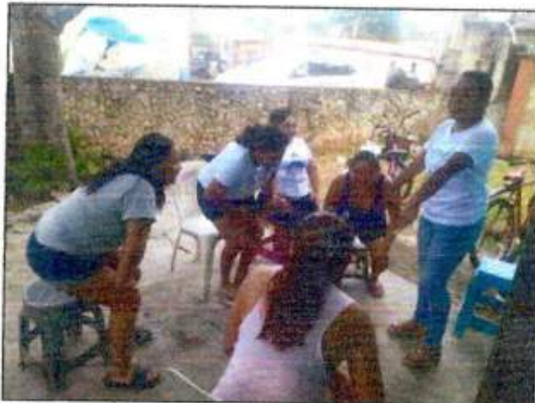
Sesión de trabajo para identificar un espacio a recuperar con las integrantes de la Red MUCPAZ (Mujeres en Armonía) del municipio de Benito Juárez – Región 75. 25/octubre/2023