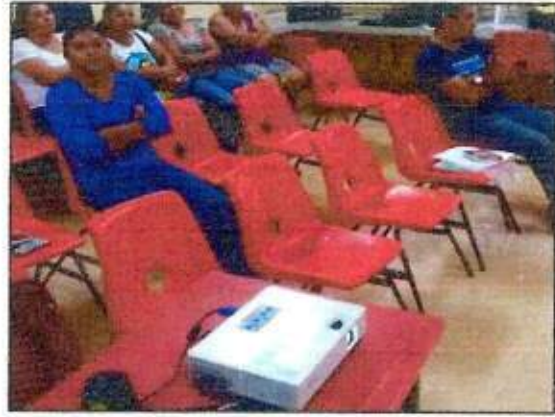
Capacitación a las integrantes de la Red MUPCAZ (Mujeres en Renacimiento) del municipio de Lázaro Cárdenas. 03/octubre/2023.