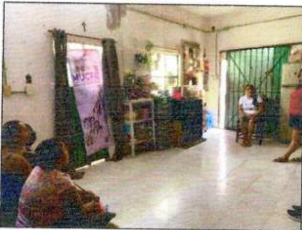
Sesión de trabajo para la construcción de un plan de acción comunitaria con la Red MUCPAZ (Mujeres en Renacimiento) del municipio de Benito Juárez – Región 68. 23/octubre/2023