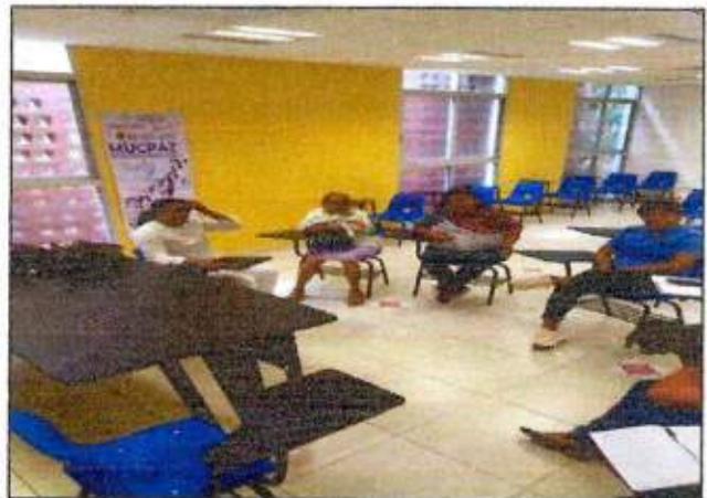
Sesión de trabajo para identificar un espacio a recuperar con las integrantes de la Red MUCPAZ (Mujeres transformadoras de paz) del municipio de José María Morelos. 19/octubre/2023