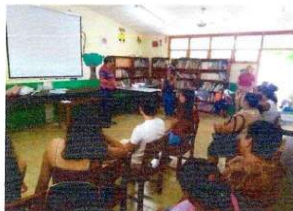
Capacitación a las integrantes de la Red de MUPCAZ (Mujeres Unidas por la Paz) del municipio de Solidaridad. 06/octubre/2023.