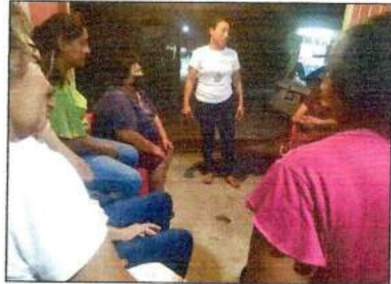
Sesión de trabajo para identificar un espacio a recuperar con las integrantes de la Red MUCPAZ (Mujeres líderes en Paz) del municipio de Othón P. Blanco. 27/octubre/2023