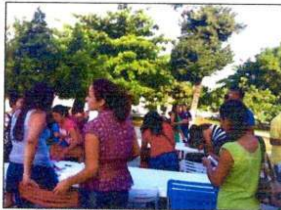
Sesión de trabajo para identificar un espacio a recuperar con las integrantes de la Red MUCPAZ (Golondrinas de Cozumel) del municipio de Cozumel. 09/noviembre/2023