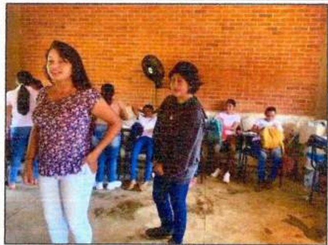
Sesión de trabajo para la construcción de un Plan de Acción Comunitaria de la Red MUCPAZ (Mujeres Renaciendo por la Paz del municipio de Lázaro Cárdenas. 10/octubre/2023.