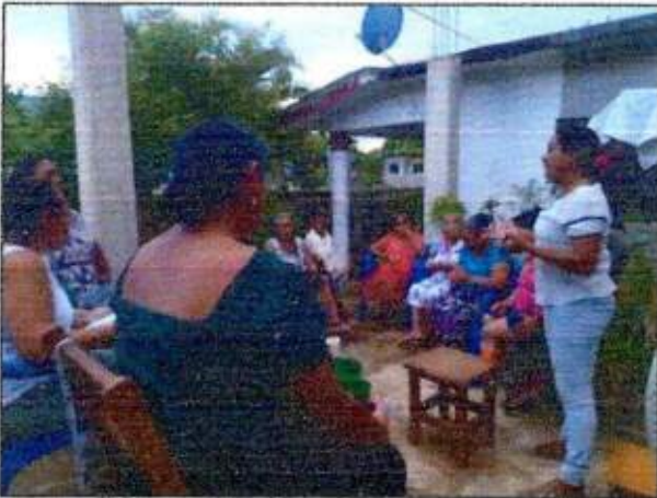
Sesión de trabajo para identificar un espacio a recuperar con las integrantes de la Red MUCPAZ (Mujeres Mayas en Acción) del municipio de Felipe Carrillo Puerto. 05/noviembre/2023