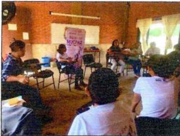
Sesión de trabajo para la construcción de un Plan de Acción Comunitaria de la Red MUCPAZ (Mujeres Renaciendo por la Paz del municipio de Lázaro Cárdenas. 10/octubre/2023.