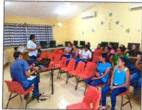
Capacitación a las integrantes de la Red MUCPAZ (Mujeres Mayas en Acción) del municipio de Felipe Carrillo Puerto. 15/octubre/2023.