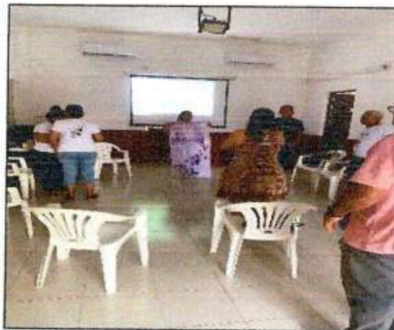
Sesión de trabajo para la construcción de un plan de acción comunitaria (Golondrinas de Cozumel) del municipio de Cozumel. 26/octubre/2023