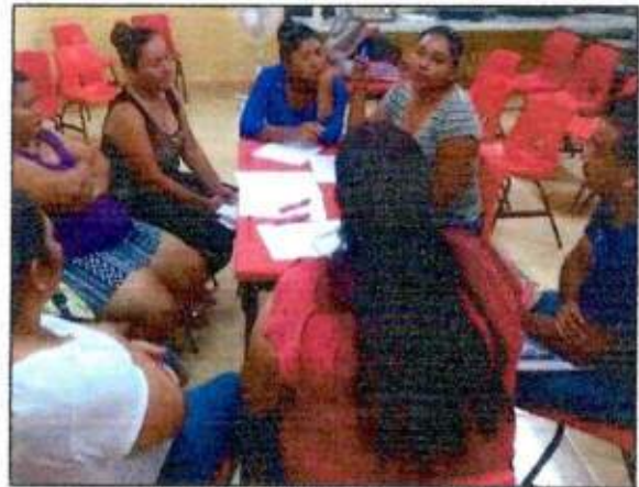
Sesión de trabajo para identificar un espacio a recuperar con las integrantes de la Red MUCPAZ (Mujeres Renacimiento por la Paz) del municipio de Lázaro Cárdenas. 17/octubre/2023