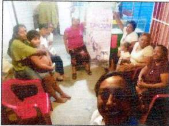
Sesión de trabajo para identificar un espacio a recuperar con las integrantes de la Red MUCPAZ (Mujeres Líderes en Paz) del municipio de Othón P. Blanco. 27/octubre/2023