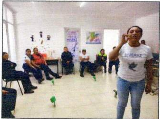
Capacitación a las integrantes de la Red MUPCAZ (Mujeres Unidas para Tulum) del municipio de Tulum. 26/octubre/2023.