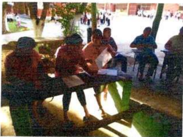
Sesión de trabajo para identificar un espacio a recuperar con las integrantes de la Red MUCPAZ (Mujeres de paz en Bacalar) del municipio de Bacalar. 16/noviembre/2023