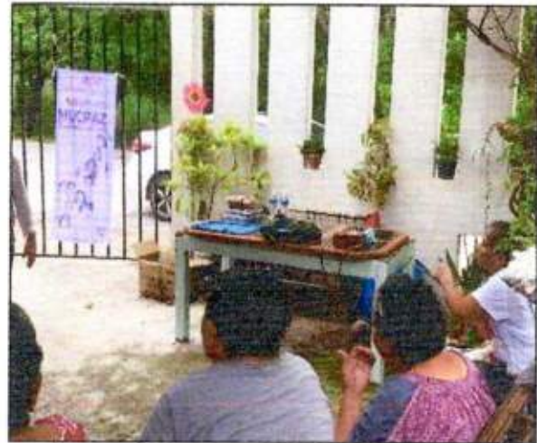
Sesión de trabajo a las integrantes de la Red MUCPAZ (Mujeres en Armonía) del municipio de Benito Juárez - Región 75. 18/octubre/2023.