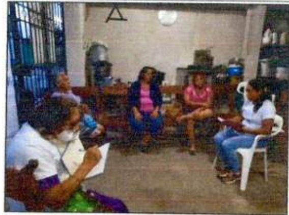
Capacitación a las integrantes de la Red MUCPAZ (Mujeres Líderes en Paz) del municipio de Othón P. Blanco. 13/octubre/2023.