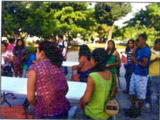
Sesión de trabajo para identificar un espacio a recuperar con las integrantes de la Red MUCPAZ (Golondrinas de Cozumel) del municipio de Cozumel. 09/noviembre/2023