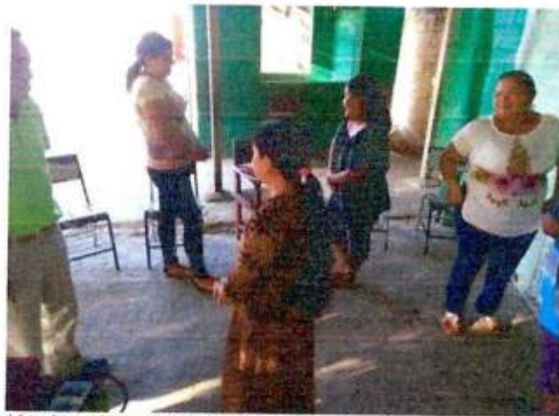
Sesión de trabajo para identificar un espacio a recuperar con las integrantes de la Red MUCPAZ (Mujeres de paz en Bacalar) del municipio de Bacalar. 16/noviembre/2023