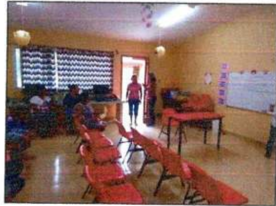
Sesión de trabajo para la construcción de un plan de acción comunitaria (Mujeres Mayas en Acción) del municipio de Felipe Carrillo Puerto. 29/octubre/2023