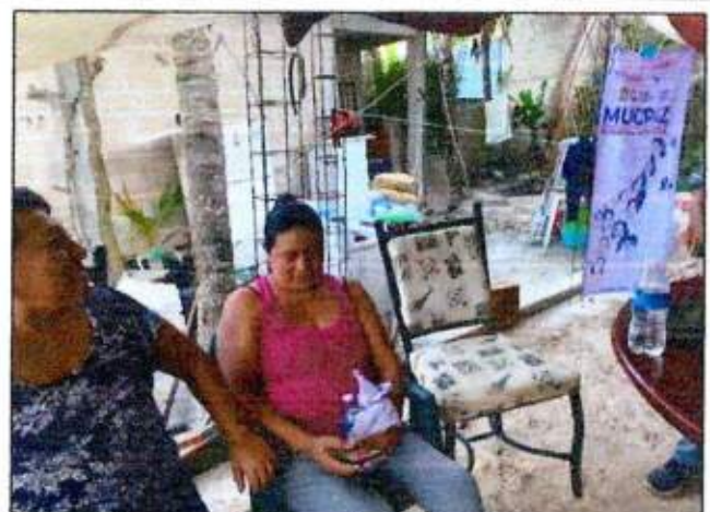
Capacitación a las integrantes de la Red MUCPAZ (Rancho Viejo Colonia Cedros) del municipio de Benito Juárez – Región 75. 11/octubre/2023