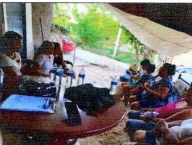
Capacitación a las integrantes de la Red MUCPAZ (Rancho Viejo Colonia Cedros) del municipio de Benito Juárez – Región 75. 11/octubre/2023