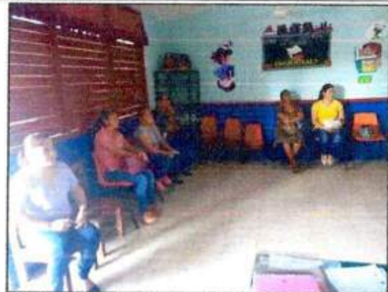
Capacitación a las integrantes de la Red MUPCAZ (Mujeres Recreatoras de Puerto Morelos) del municipio de Puerto Morelos. 19/octubre/2023.