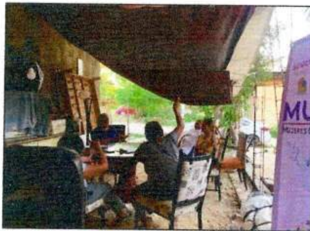
Sesión de trabajo para la construcción de un Plan de Acción Comunitaria de la Red MUCPAZ (Mujeres Creadora de Paz) del municipio de Isla Mujeres. 27/octubre/2023.