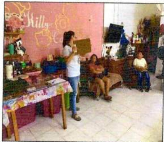
Capacitación a las integrantes de las Redes MUCPAZ (Mujeres en renacimiento) del municipio de Benito Juárez - Región 68. 16/octubre/2023